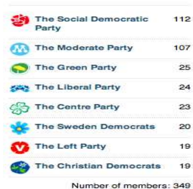
[그림 Ⅷ-2] 스웨덴 정당 및 의원 수

스웨덴 의회의 중요 임무는 법안 및 예산의 심의와 결정, 내각에 대한 견제, 외교정책의 결정, 그리고 유럽연합문제에 대한 결정 등 크게 다섯 분야로 나누어 볼 수 있다. 특히 외교문제 및 유럽연합 문제와 관련하여 국회는 정부와 공조를 취하면서 그 기본 골격을 결정하게 된다. 정부가 독단적으로 외교정책의 노선이나 유럽연합의 문제에 있어서의 스웨덴의 입장을 결정하지 않는다는 의미이다. 이러한 외교정책노선의 결정에 있어서 국회 역시 독단적으로 결정하지 않으며 항상 정부와의 공조체제를 유지하고 있다(Sverigesriksdag, 2007).